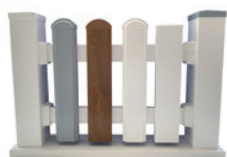
Tischmuster Exklusiv Vorgartenzaun